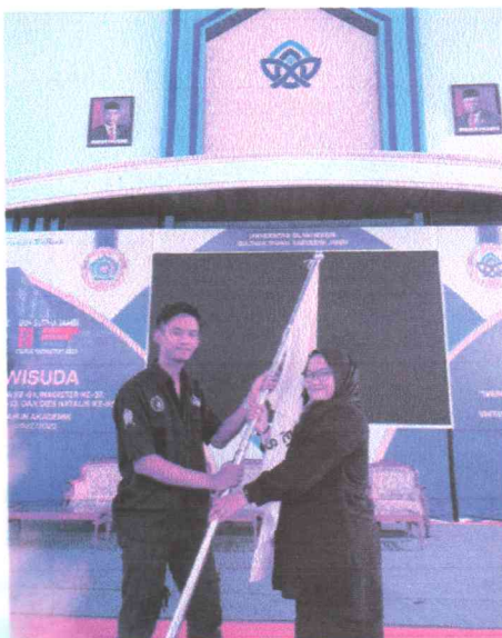
Pelepasan BPH demisioner