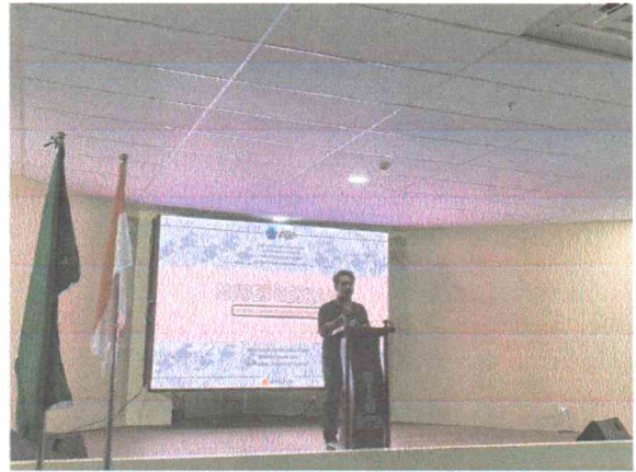
Pembacaan umul quran oleh petugas