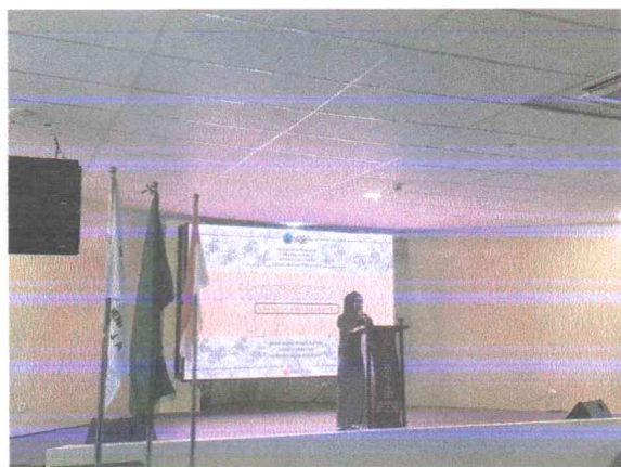
Sambutan Ketua Umum/ yang mewakilkan