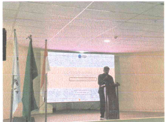
Laporan Ketua Panitia