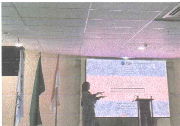
Menyanyikan Indonesia raya dan mars UIN