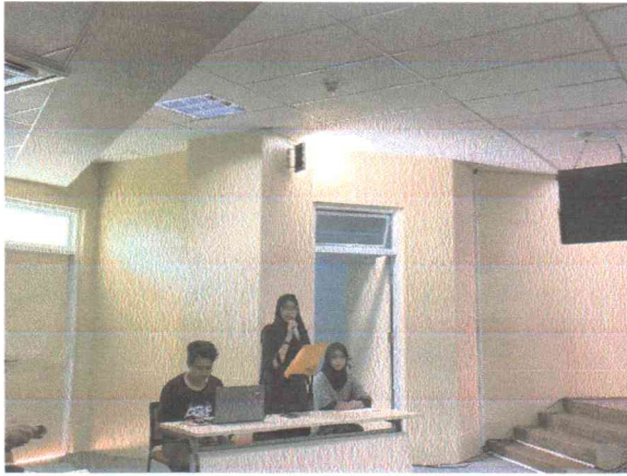
Pembukaan acara oleh MC