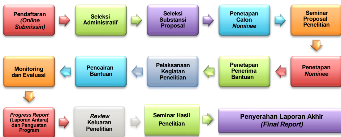
Gambar 4.1: Alur (Proses) Pengelolaan Bantuan Penelitian Berbasis Standar Biaya Keluaran

Tahapan dan penjelasan masing-masing proses bantuan penelitian berbasis standar biaya keluaran ini, dapat dilihat pada gambar di bawah ini.