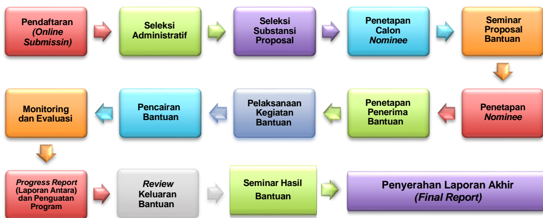
Gambar: Alur Proses Pengelolaan Bantuan