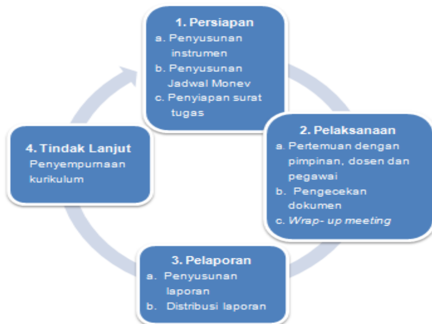
Gambar 2.1 Siklus Monitoring dan Evaluasi Kurikulum

Secara ringkas, tahapan monev dapat digambar seperti Gambar 2.1