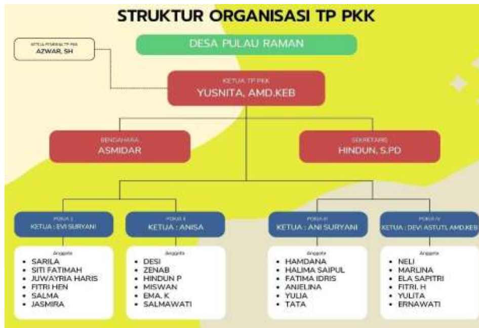
Tabel 2