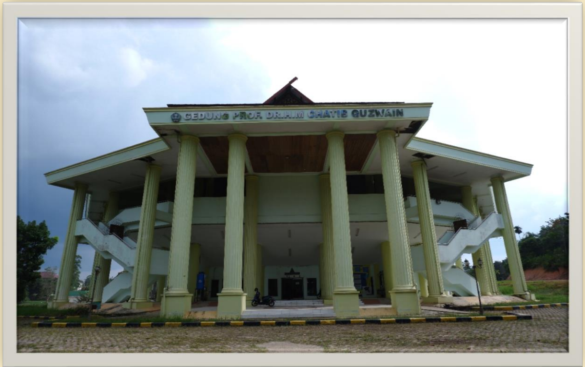
Auditorium Prof. Dr. H.M Chatib Quzwain